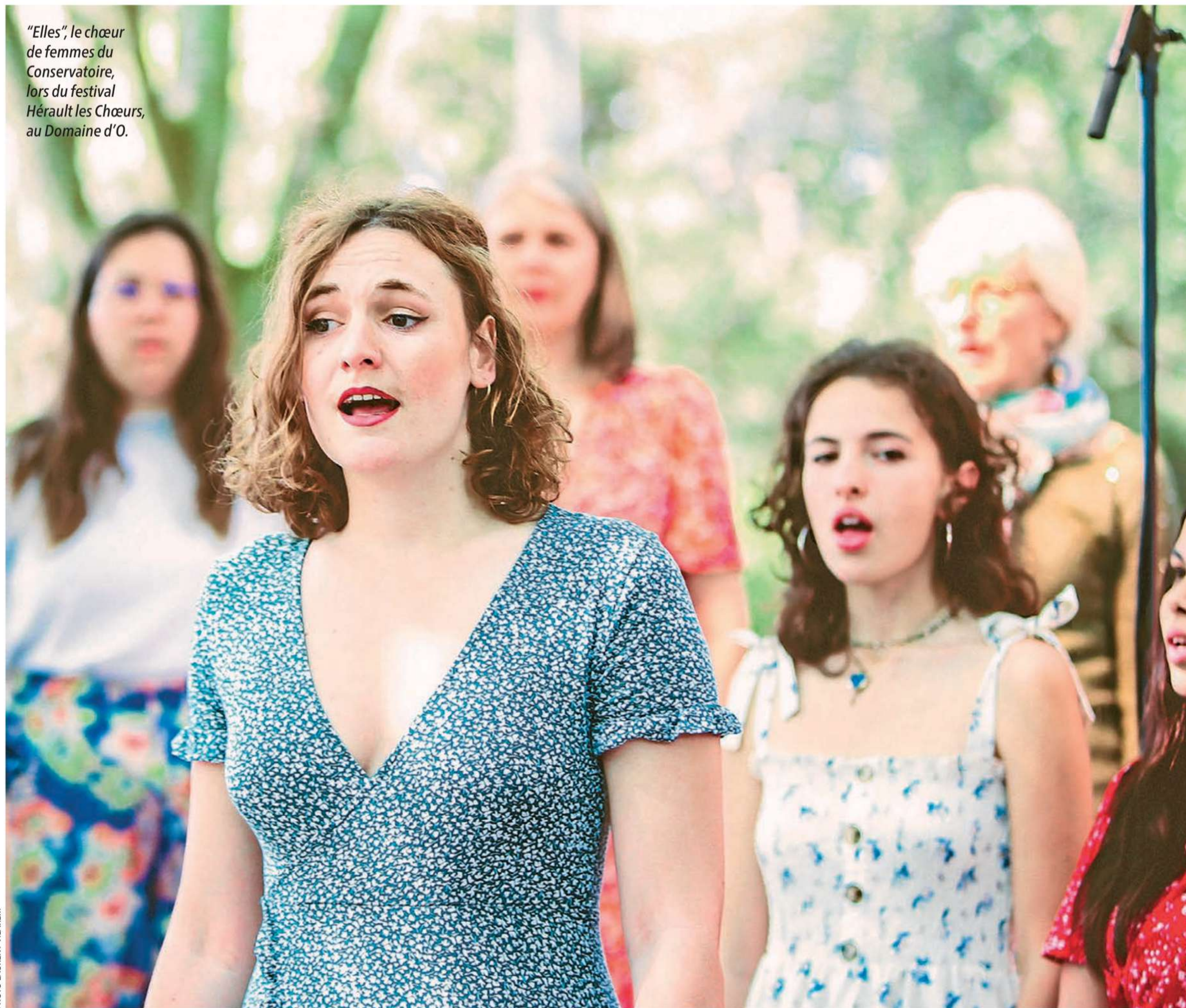
"Elles", le chœur de femmes du Conservatoire, lors du festival Hérault les Chœurs, au Domaine d'O.